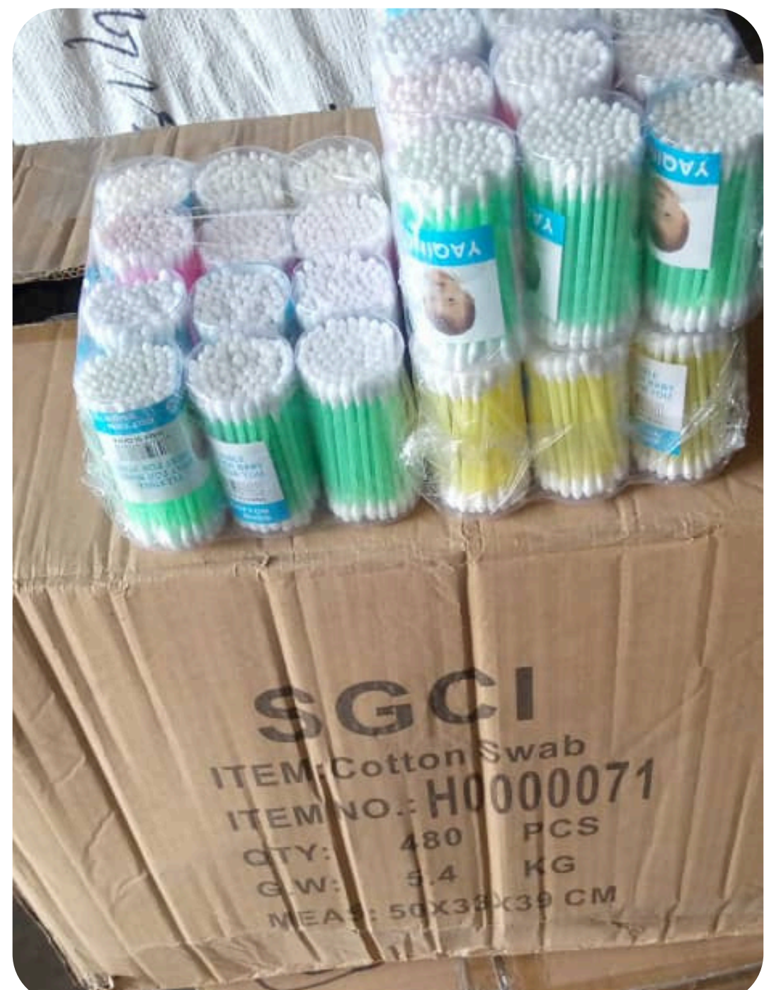
TIGE COTON CAMERA