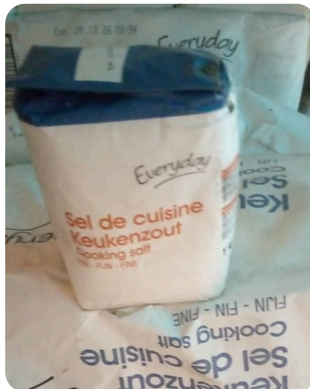
SEL DE CUISINE