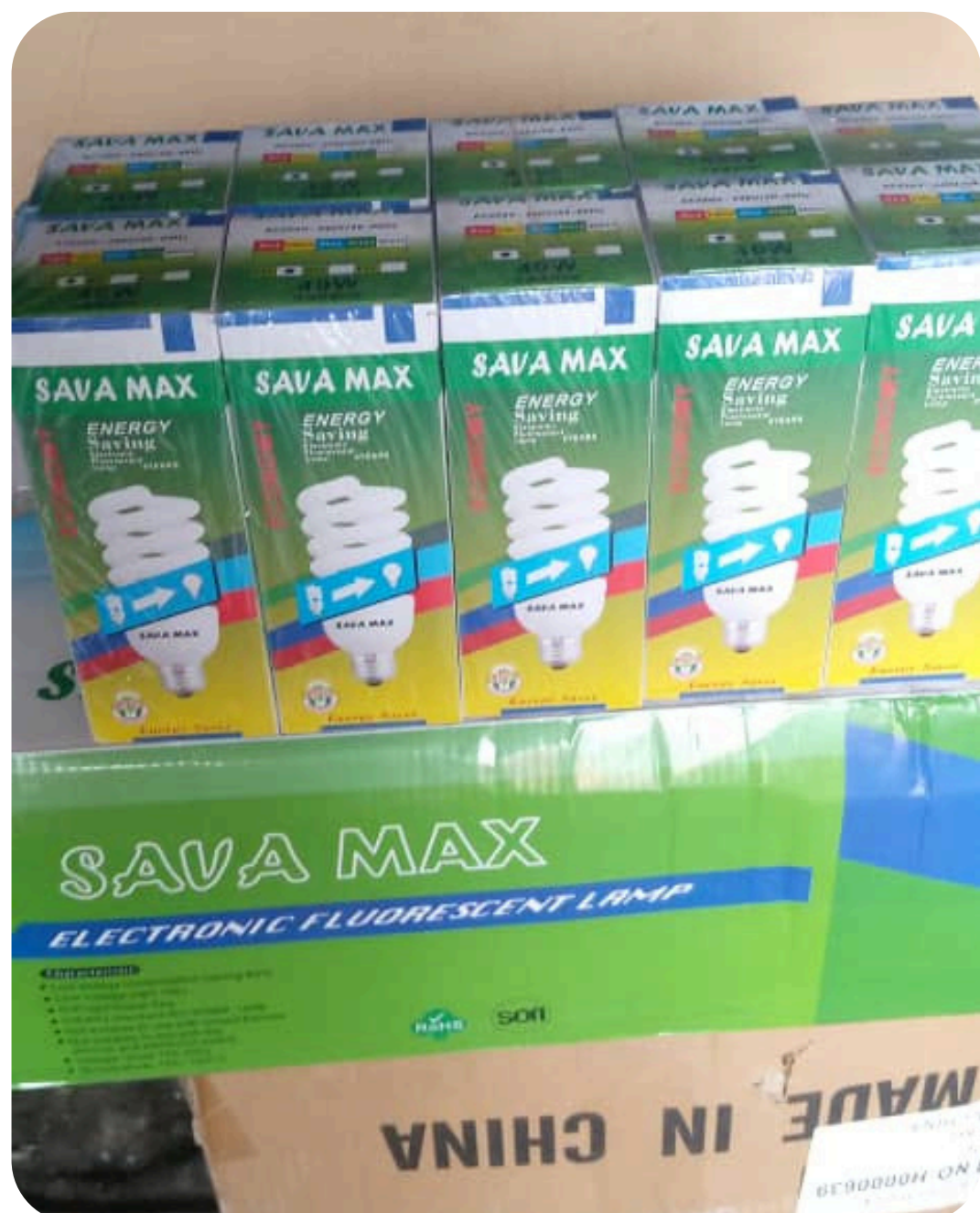
AMPOULE SAVA MAX