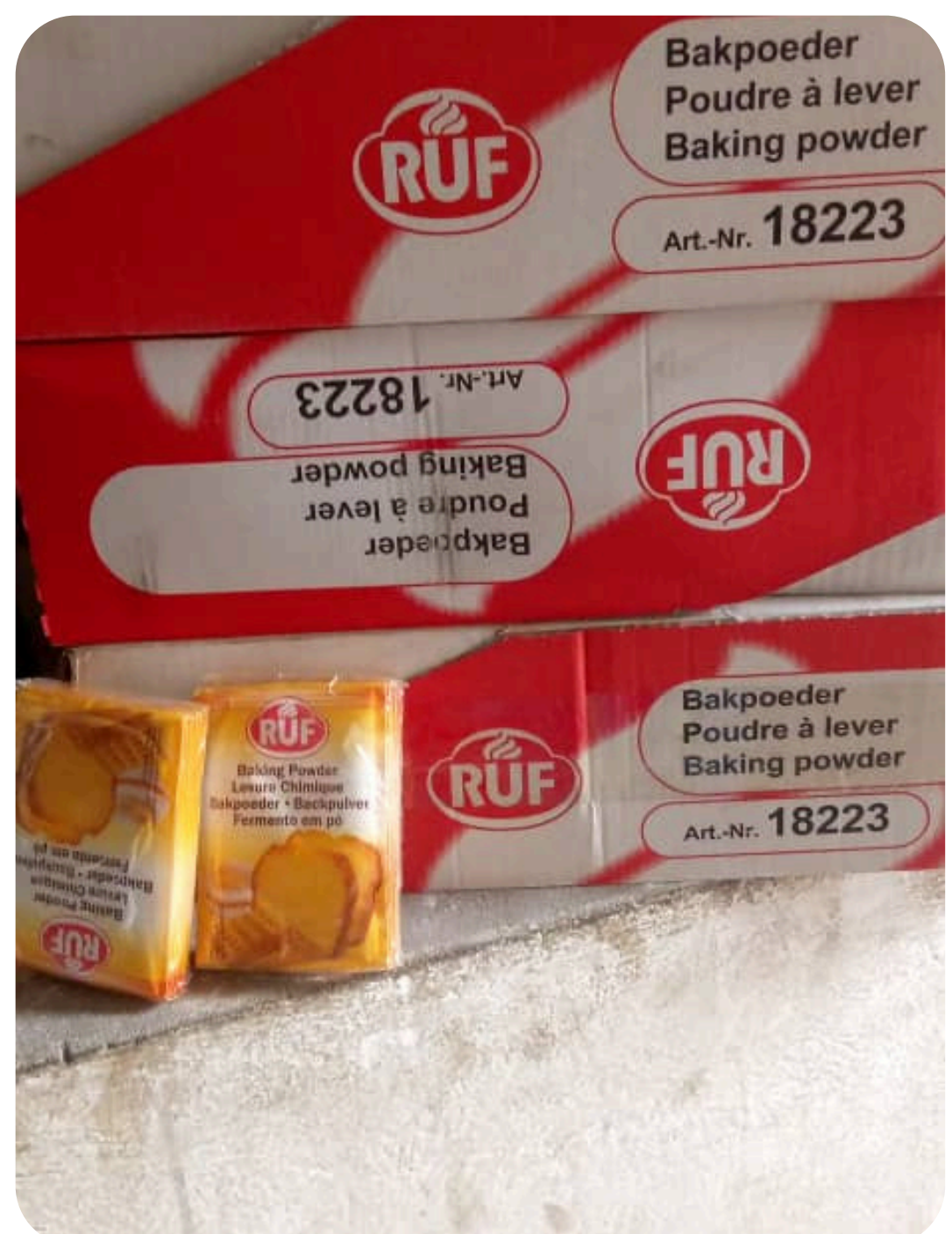
LEVURE CHIMIQUE RUF