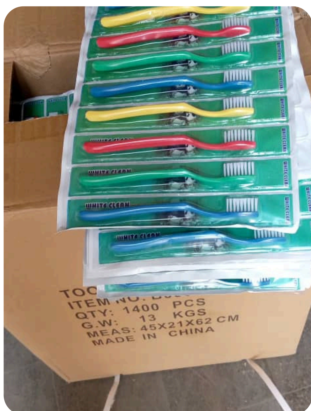
BROSSE A DENT BLANCHE / ENFANT