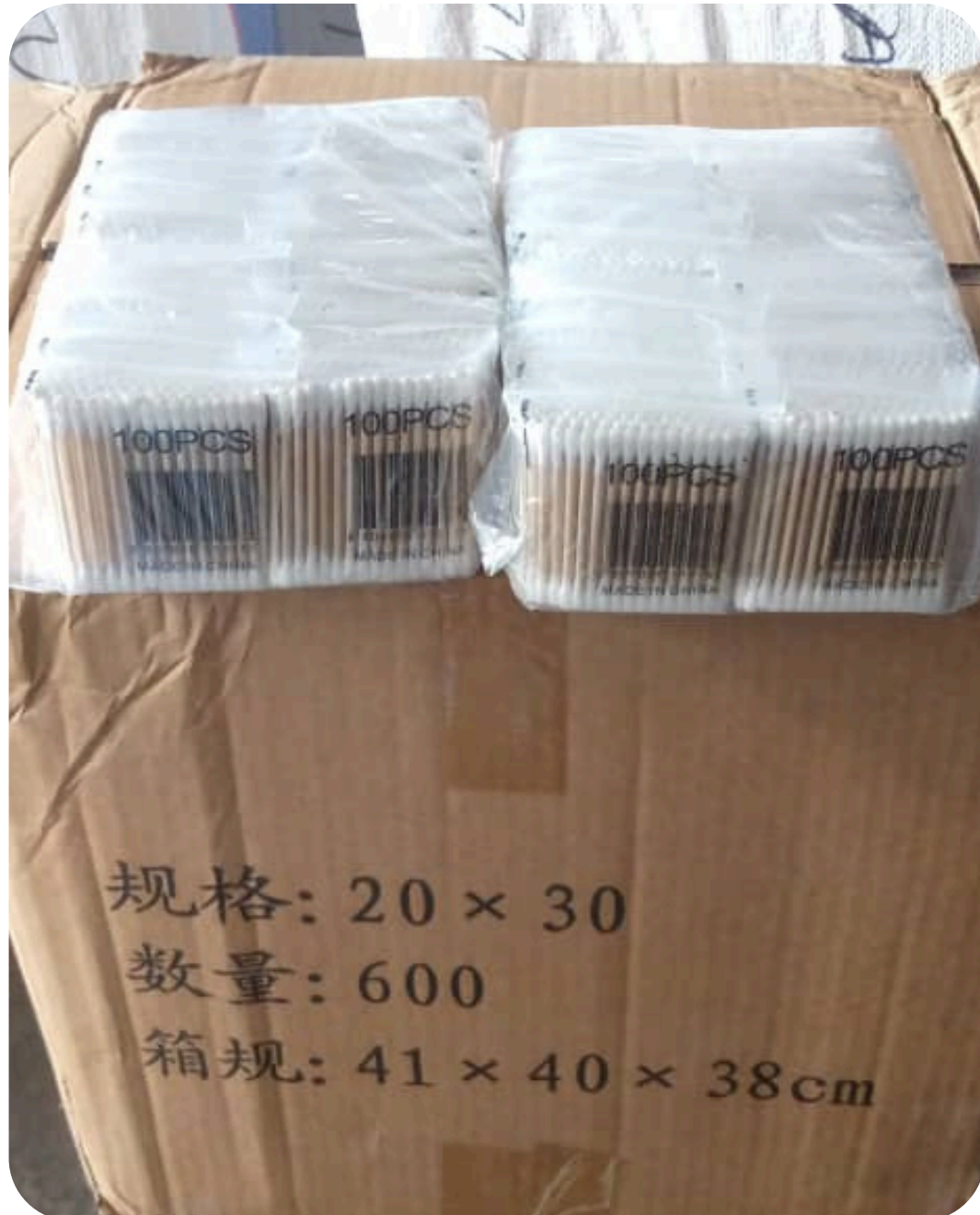
TIGE COTON LIBAYA