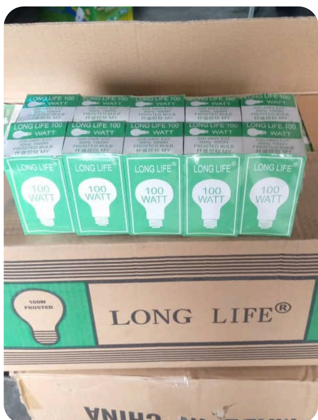
AMPOULE LONG LIFE