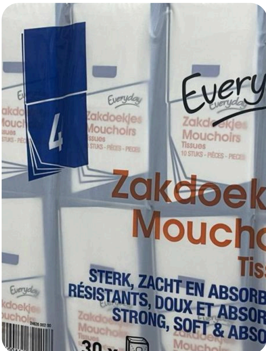
PAPIER MOUCHOIR EVD