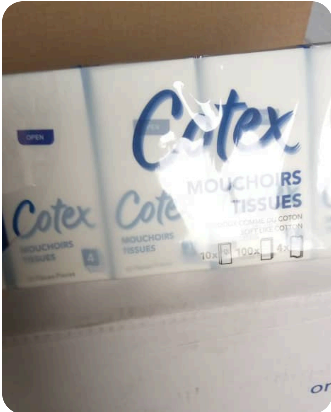
PAPIER MOUCHOIR COTEX BLUE