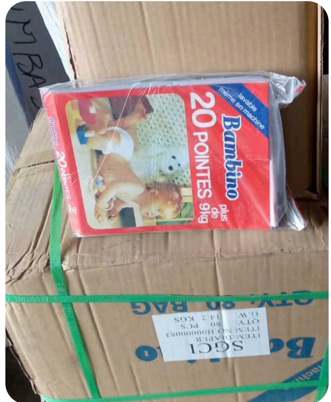
CACHE COUCHE BAMBINO