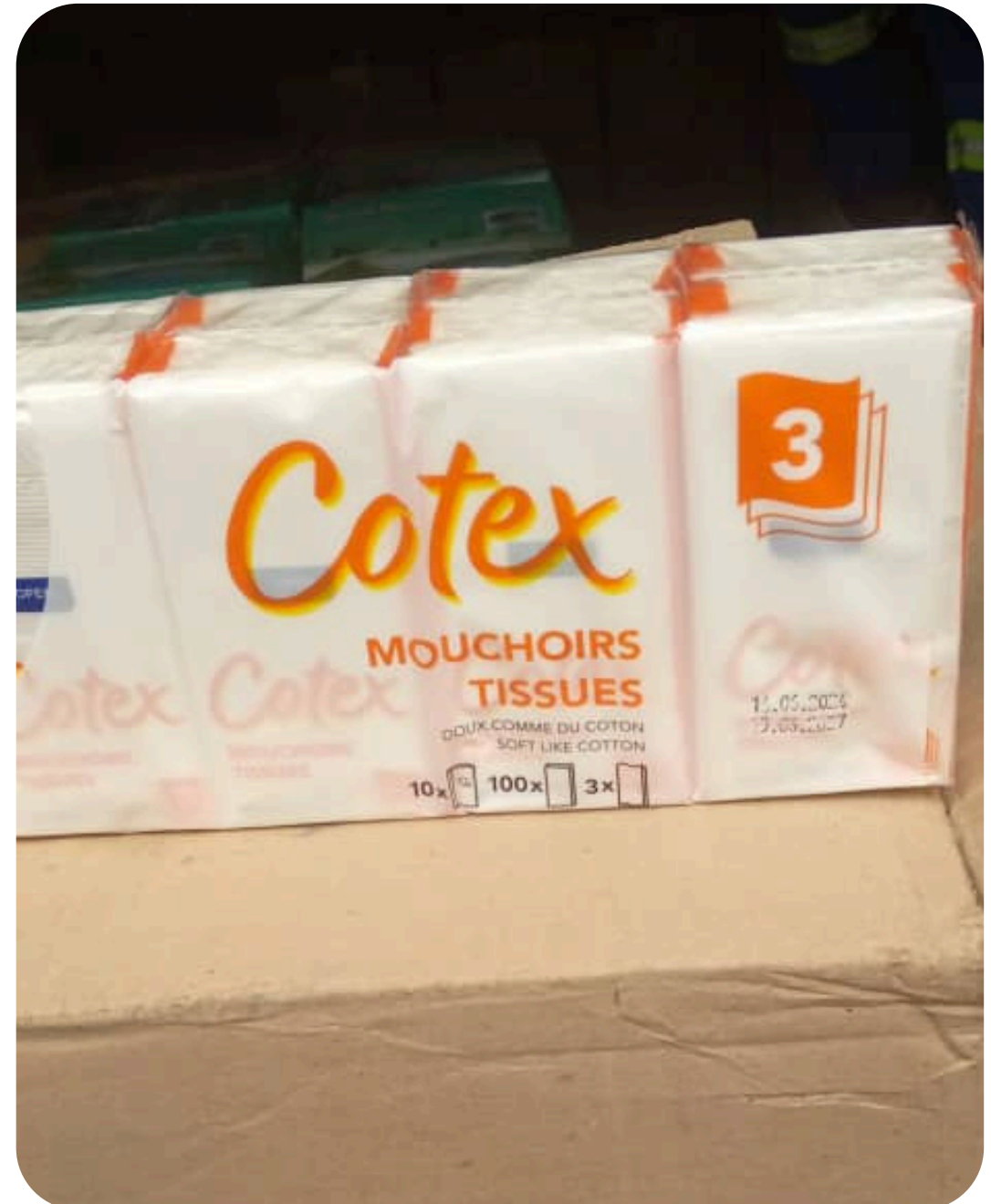
PAPIER MOUCHOIR COTEX ORANGE