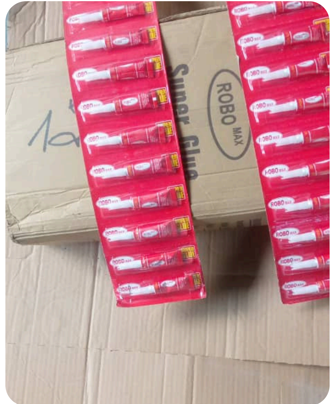
SUPER GLUE ROBO MAX