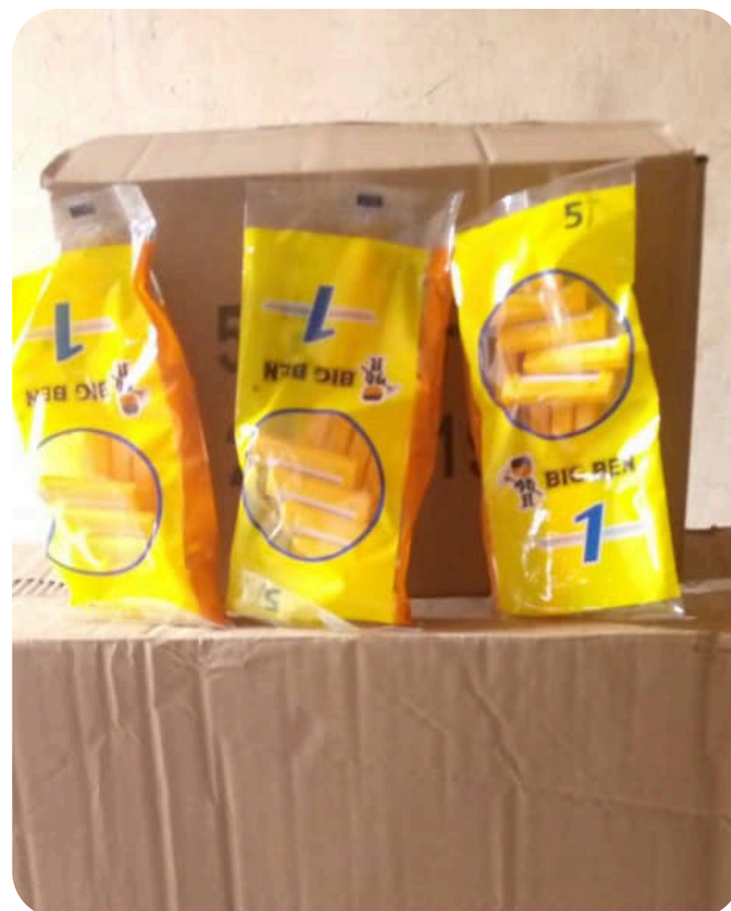
BIC RASOIR / BIG BEN